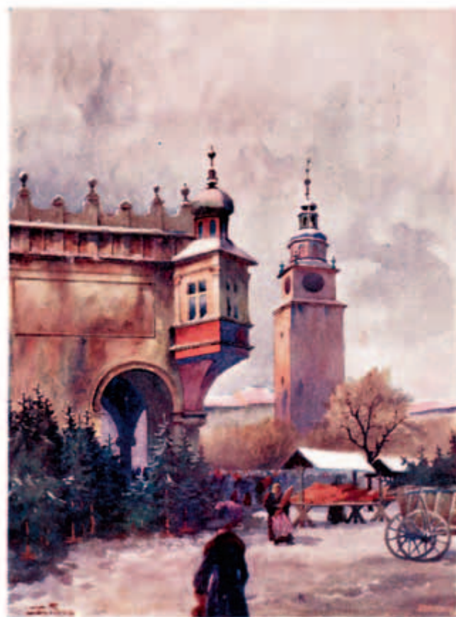
ST. TONDOS pin.

Przepis ten pochodzi z wydanego w Krakowie w 1946 roku „Nowego Kucharza Krakowskiego”. W podobnych przepisach na ten typowo