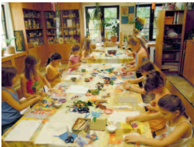
Warsztaty plastyczne w KDK

Tradycyjnie w niedzielę przed 6 grudnia odbywa się w KDK przedświąteczny kiermasz decoupage'u, i rękodzieła, na którym można zobaczyć i kupić przedmioty wykonane przez uczestników warsztatów decoupage'u organizowanych w naszej placówce. Prace wykonane w różnych technikach (dekupaż, fimo, biżuteria, scrappbooking, szydełko, ceramika i inne) tworzą niepowtarzalną wystawę. Kiermasz bożonarodzeniowy jest okazją do zakupu jedynych w swoim rodzaju, oryginalnych i pięknych prezentów i ozdób świątecznych.