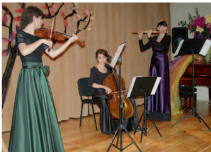
Koncert muzyki barokowej

Za nami jesień, która w Katolickim Domu Kultury obfitowała w ciekawe wydarzenia artystyczno – kulturalne. Dzień Papieski uczciliśmy w tym roku otwarciem II cz. wystawy „Człowiek, duszpasterz, mąż stanu – kardynał Adam Stefan Sapieha” oraz koncertem muzyki barokowej. W niedzielę, 11 listopada, przypadło Narodowe Święto Niepodległości. Pamiętając o naszym wspólnym domu, jakim jest wspólnota wszystkich Polaków, okupiona obfitą daniną krwi i męczeństwa wielu pokoleń rodaków, spotkaliśmy się w ten dzień o godz. 19.00 na wieczorze pieśni patriotycznej.